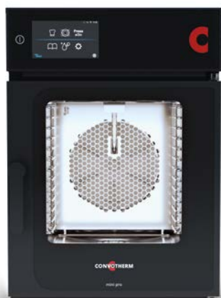
mini pro 6.06