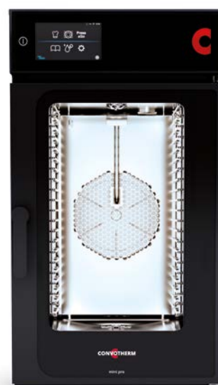
mini pro 10.10