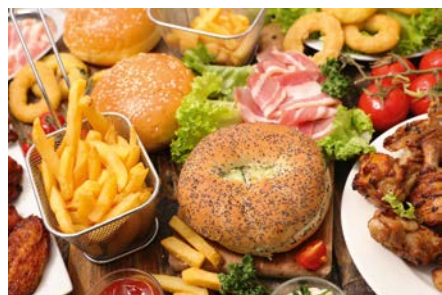
mini pro 6.10 + 10.10

Расширяйте ваше меню благодаря огромным возможностям приготовления.