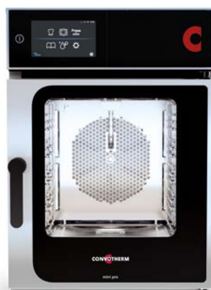
mini pro 6.10